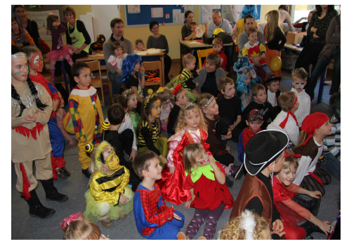
Märchenfest im Kindergarten