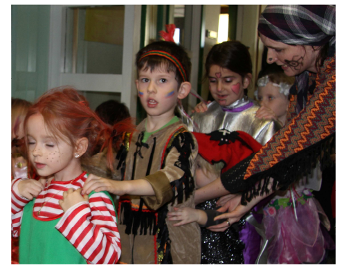
Ball-Splitter – Fasching 2013