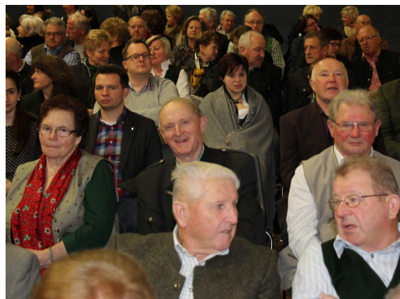
links: Klein- gruppen- treffen