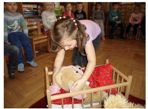
Thema „KÖRPER“ im Kindergarten ...