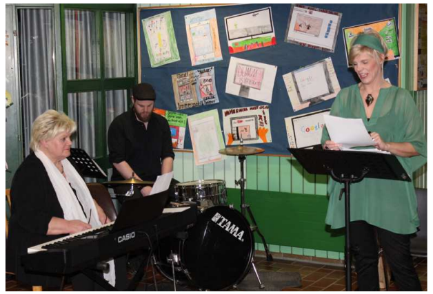
oben: KIMM – 8.3. / unten: Second-Hand-Basar – 13.,14.3.