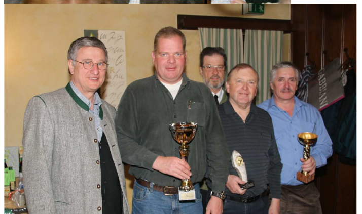
unten: ÖKB- Kegeln, Männer