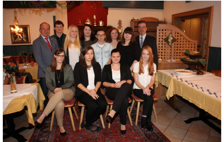
Wir gratulieren sehr herzlich; viel Erfolg weiterhin!

Alle Informationen dazu finden Sie auf unserer Homepage unter: http://www.mooskirchen.at/05-09-2014-Anerkennung-fuer-junge-GemeindebewohnerInnen-zu-Ausbildung.4042.0.html