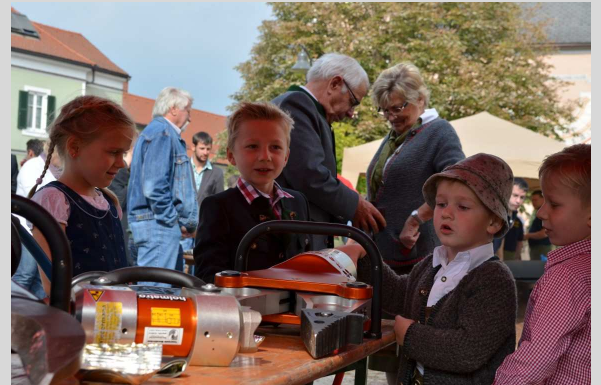
FeuerwehrkameradInnen der Zukunft??

Mit dieser Aktivität wollen die FeuerwehrkameradInnen DANKE für die jährliche Unterstützung unserer Gemeindebewohner/innen sagen und zeigen, dass sie für Sie nicht nur im Einsatzfall stets bereit sind.