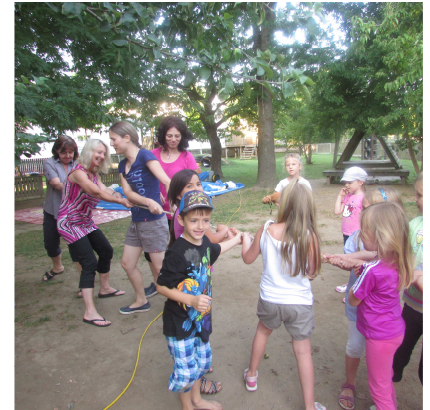
sind die Kinder im Vorteil? ...