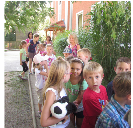
auf ein köstliches Eis zu „faMoos“