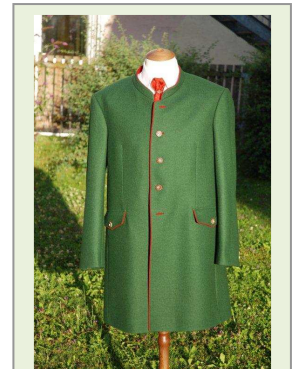
„Mooskirchner Altsteirertracht“ neu: erste Eindrücke