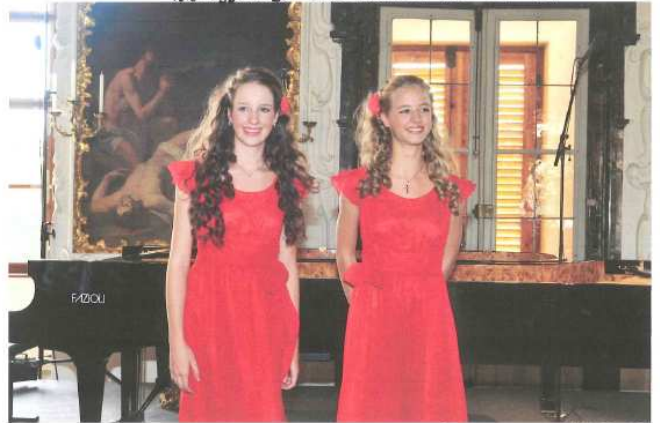
Foto: Eggenberger Schlosskonzert am 13.9.2009