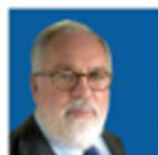
MIGUEL ARIAS CAÑETE