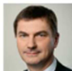
ANDRUS ANSIP VICE-PRESIDENT