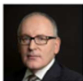
FRANS TIMMERMANS FIRST VICE-PRESIDENT