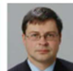
VALDIS DOMBROVSKIS VICE-PRESIDENT