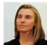
FEDERICA MOGHERINI HIGH REPRESENTATIVE