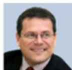
MAROŠ ŠEFCOVIC VICE-PRESIDENT