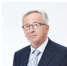
JEAN-CLAUDE JUNCKER PRESIDENT-ELECT