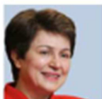
KRISTALINA GEORGIEVA VICE-PRESIDENT