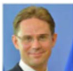
JYRKI KATAINEN VICE-PRESIDENT