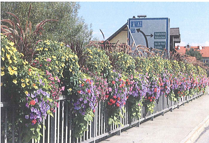
Brücke über die KAINACH, Mooskirchen Teilnahme Landesbewerb: SONDERPROJEKT