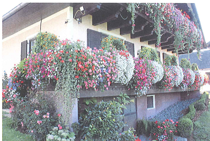
Familie Hochstrasser, vlg. Kluagn, Weinberg Teilnahme Landesbewerb: BAUERNHOF – Silbermedaille 2011