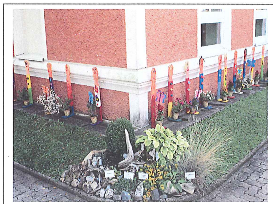
Blumenprojekt – Kindergarten 3-gruppig – Anerkennung 2011