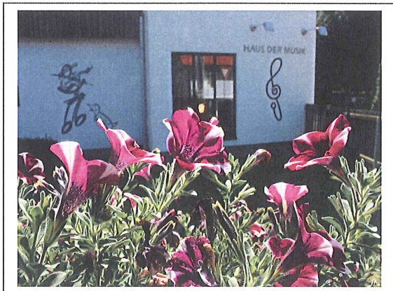
„Haus der Musik“, Mooskirchen, Hauptstraße