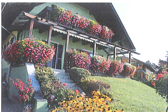
Familie Schlögl, Kainachstraße