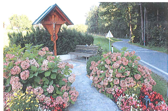
Wegkreuz in Rauchegg