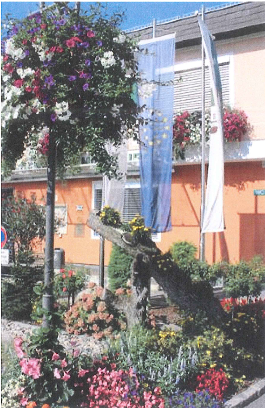
Amtsgebäude am Marktplatz