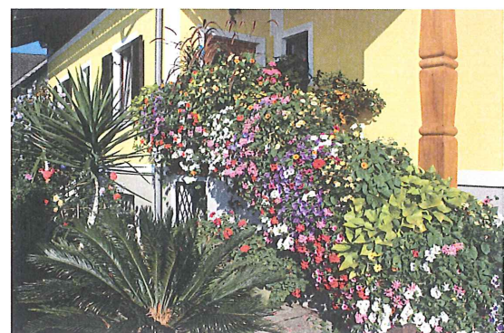
Familie Sippel, Kainachstraße