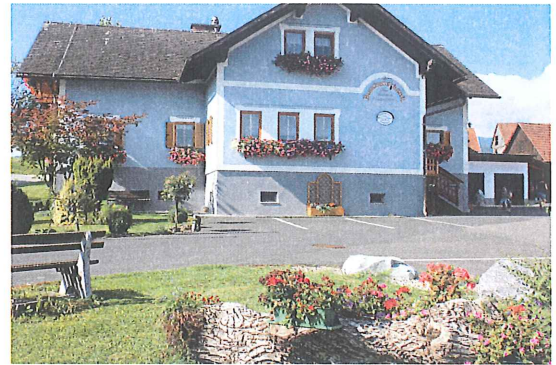
Buschenschank-Weinhof Bauer, vlg. Prall, Rubmannsberg Teilnahme Landesbewerb: BUSCHENSCHANK – Anerkennung 2011