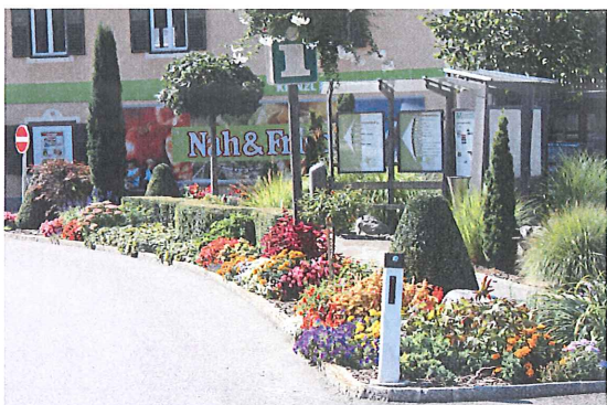
Oberer Markt Mooskirchen