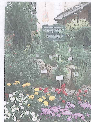
Ein Hingucker in Mooskirchen: diese liebevoll gestaltete Kräuterspirale

Am 12. Juli wird eine zwölfköpfige Jury die Marktgemeinde Mooskirchen genau unter die Lupe nehmen und nach verschiedenen Kriterien bewerten. „Nervös bin ich nicht, aber natürlich stolz. In den vergangenen Jahren haben wir bei unserer Blumen-gestaltung bereits Erfahrungen sammeln können, die uns jetzt zugute kommen“, berichtet En-