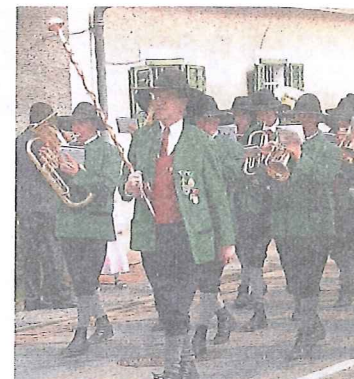
Die Blasmusik von Mooskirchen ist ein