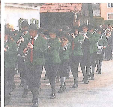
Garant für gute Konzerte.