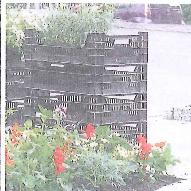
an allen öffentlichen Plätzen gepflanzt.