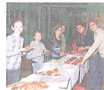
Eine gesunde Jause für die Schüler.

Ein weiteres Projekt ist die Nahwärme. „Wir haben einen hohen Versorgungsgrad mit Gas, aber ein privater Investor hat Interesse, ein Nahwärme-Heizwerk hinzustellen. Wir werden uns jetzt einige Anlagen anschauen und Informationen einholen“, so der Ortschef. Die öffentlichen Gebäude sollen ebenso angeschlossen werden wie alle neuen Bauten.