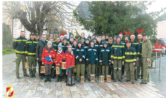
für die Freiwillige Feuerwehr Markt Mooskirchen:

Der REINERTRAG wird für die laufende Arbeit mit unserer Feuerwehrjugend verwendet.