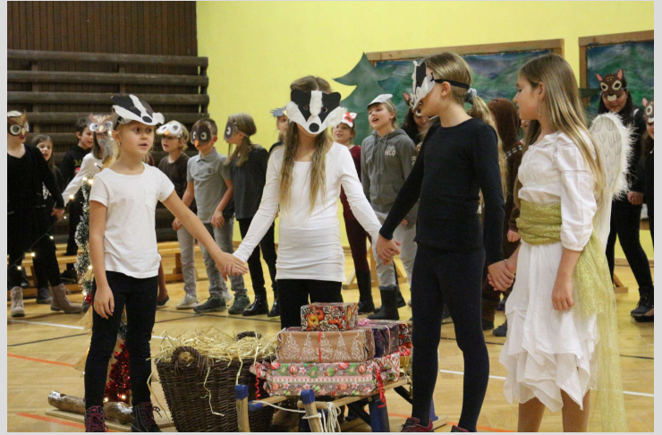
Volksschüler – bei der Adventfeier am 2. Dezember 2019