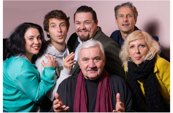
„die Grazbürsten“ – Samstag, 14.3., 19.30h, TH

Medieninhaber: MARKTGEMEINDE MOOSKIRCHEN, 8562 – Tel. 0676846212800 f.d. Inhalt verantwortlich: Bgm. Engelbert HUBER, Marktplatz 4, 8562 Mooskirchen – Herstellung Colorprint, Voitsberg – Erscheinungsort: 8562 Mooskirchen – Zugestellt durch Post.at