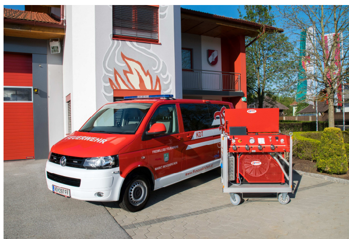
Mannschaftsfahrzeug und Atemluftkompressor