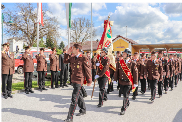
Defilierung vor den Ehrengästen – am Marktplatz Mooskirchen