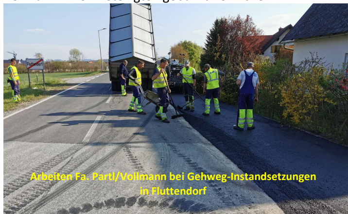
Arbeiten Fa. Partl/Vollmann bei Gehweg-Instandsetzungen in Flutendorf

Auch unsere Mitarbeiter haben beste Arbeit mit rascher Herstellung aller Bankette geleistet. Und die Finalisierung war Fa. Liesen mit der Befestigung der Bankette übertragen. Dass es möglich war, alle diese genannten Arbeiten innerhalb von 4 Arbeitstagen zu bewältigen, grenzt an ein Wunder. Zeigt aber auch, dass gute Vorbereitung mit bestmöglicher Ausführung aller übertragenen Maßnahmen einhergehen kann. Allen Beteiligten gebührt herzlicher DANK .