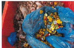
Abb.3: Ohrmarken/Kunststoffsäcke in SNP-Container