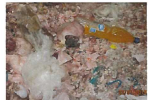
Abb.4: Kunststoffflasche/Kunststoffe in SNP