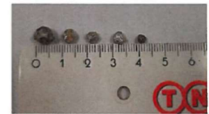
Abb.6: Verschiedene Metalle im Endprodukt

Bitte beherzigen diesen Hinweis zur Abfalltrennung: