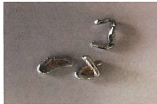
Abb.1: Wurstklips in Rohware gefunden