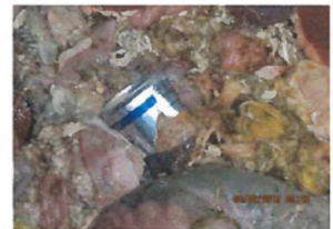
Abb.2: Aluminiumdose in SNP