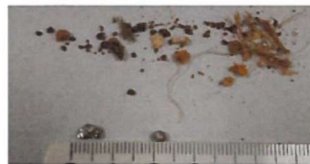
Abb.5: Aluminiumpartikel und Kunststofffasern im Endprodukt