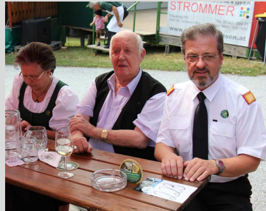
Zirknitzberg: „der Berg ruft“

ihm stets ein Anliegen, auch davon können einige Geschichten erzählt werden. Er war ein gern gesehener Gast auf dem Zirknitzberg, hat auch unzählige schöne Stunden bei unserem Kapellenfest mit Fröhlichkeit verbracht. Ein Vergelt's Gott und Ruhe in Frieden!