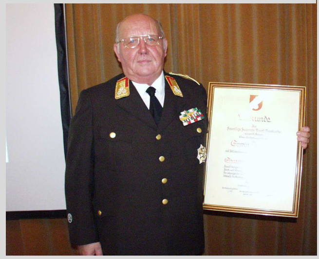
Ehren-Orts- und -Bezirksfeuerwehrkommandant