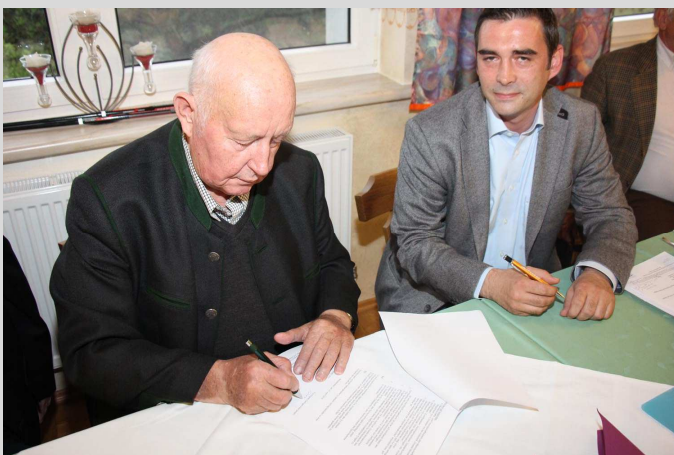
Bei der Unterzeichnung des letzten Sponsorvertrages am 12.5.2016.