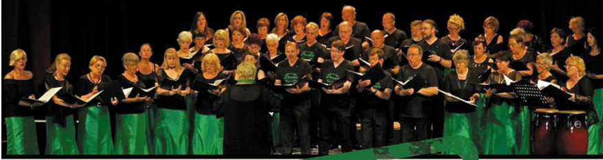
Plakat: Markus Gnaser