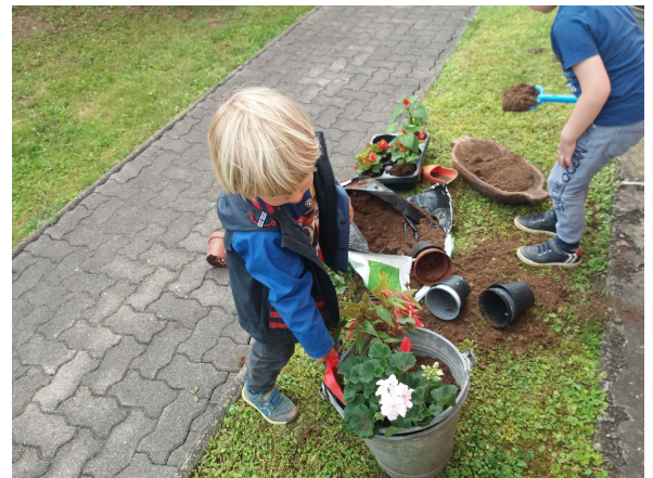
Wertvolle alte, nicht mehr gebrauchte Gegenstände finden Verwendung – „upcycling“ .....