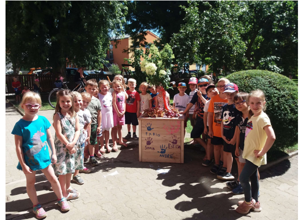
Kindergarten-Kinder nehmen Abschied in Richtung Volksschule'