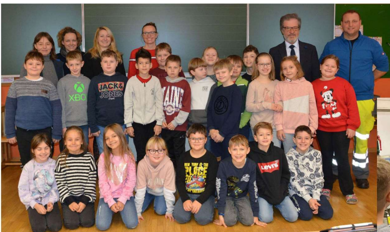
das Energieteam an der Volksschule

Das Energiespar-Projekt „50/50“ ist ein Projekt des Klimabündnis Steiermark, das im Auftrag vom Land Steiermark (Abteilung 15, Fachabteilung Energie und Wohnbau) im Rahmen der „Ich tu's – Klimaschutzinitiative“ des Landes Steiermark in 21 Schulen durchgeführt wird. Das Potential für Einsparungen ist groß. 12 steirische 50/50-Schulen, die beim letzten Mal am Projekt teilgenommen haben, konnten so über 11.000,- € einsparen. Anders ausgedrückt waren es 34.774 kWh elektrischer Strom und 83.655 kWh Heizenergie. Das entspricht knapp 36 Tonnen Kohlendioxid. Im Durchschnitt erhielten die Schulen 430,- € als Bonus für ihre Bemühungen, der höchste Bonus für eine Schule waren stolze 1280,- €.