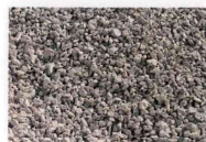
Betonrecycling 0/63 mm