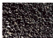
Asphaltrecycling 0/16 mm