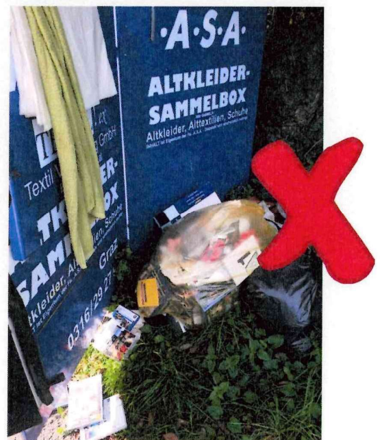
Kein loses Material! Keine anderen Abfälle! Keine Ablagerung neben dem Container!