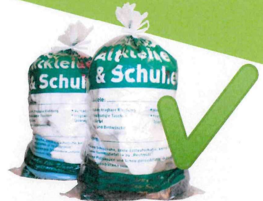
Durchsichtige Säcke aus Kunststoff! Oben zugebunden!

Im Sinne der Ressourcenschonung, Nachhaltigkeit und Wirtschaftlichkeit bitten wir, obige Punkte konsequent einzuhalten. Nur so funktioniert eine zukunftsfähige Kreislaufwirtschaft – DANKE für Ihre Mithilfe!