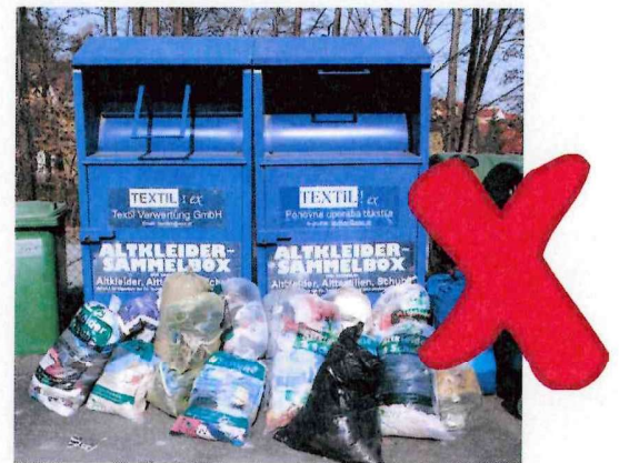
Keine schwarzen, blauen oder gelben Säcke! Keine Säcke neben dem Behälter!