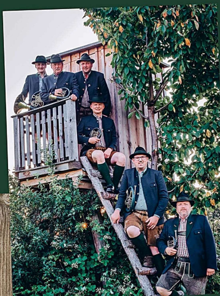
Jagdhornbläser „Unteres Kainachtal“

Samstag 09.09. Einlass 19 Uhr Beginn 20 Uhr